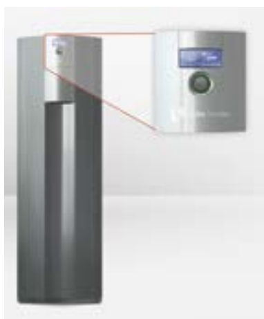
Pompe di calore con regolatore Luxtronik 2.0/2.1